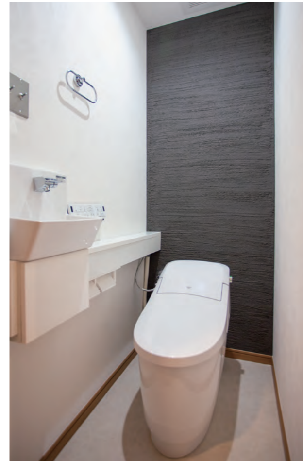
トイレ | 設備交換