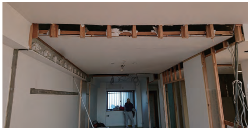
96 施工中[リビングから北洋室]