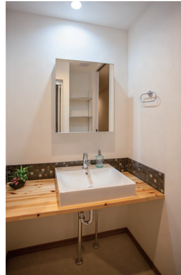
洗面 | 設備交換