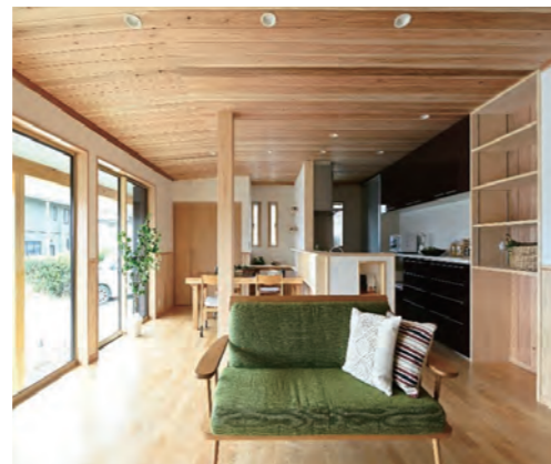
内装 床・壁・天井全面張り替え、サッシ | 交換