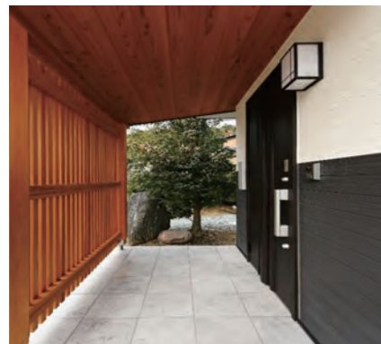
玄関扉 | 交換 外壁 | 張り替え