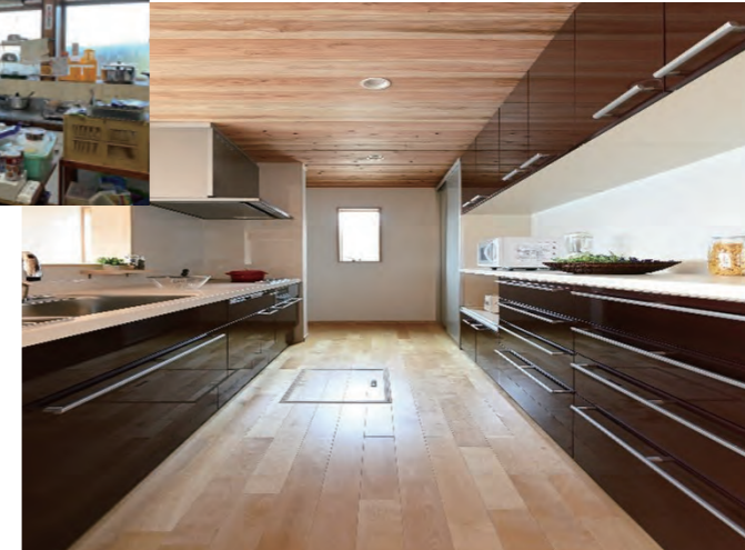
キッチン | 設備取り替え