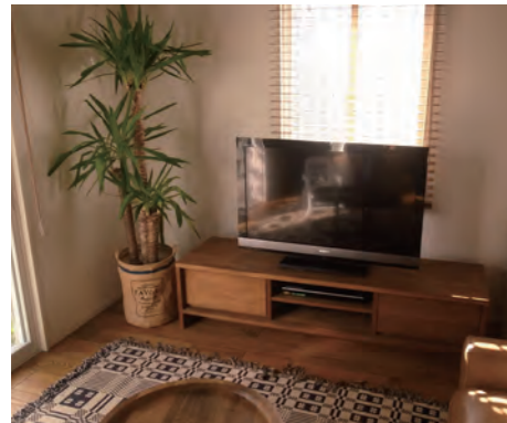
リビング | 断熱改修[床・壁]