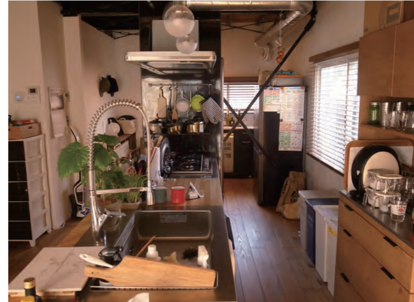
キッチン | 位置変更、設備取り替え