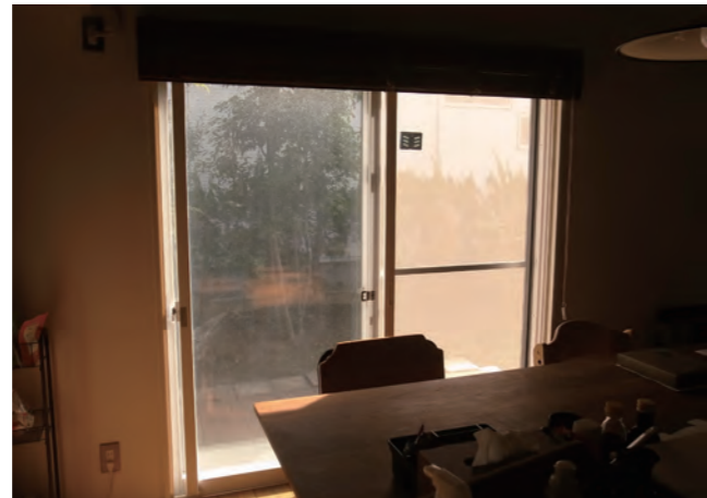
66 窓 | 二重サッシに交換