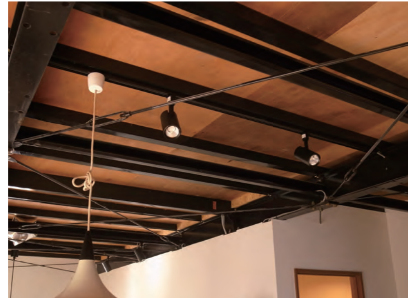
天井 | 撤去